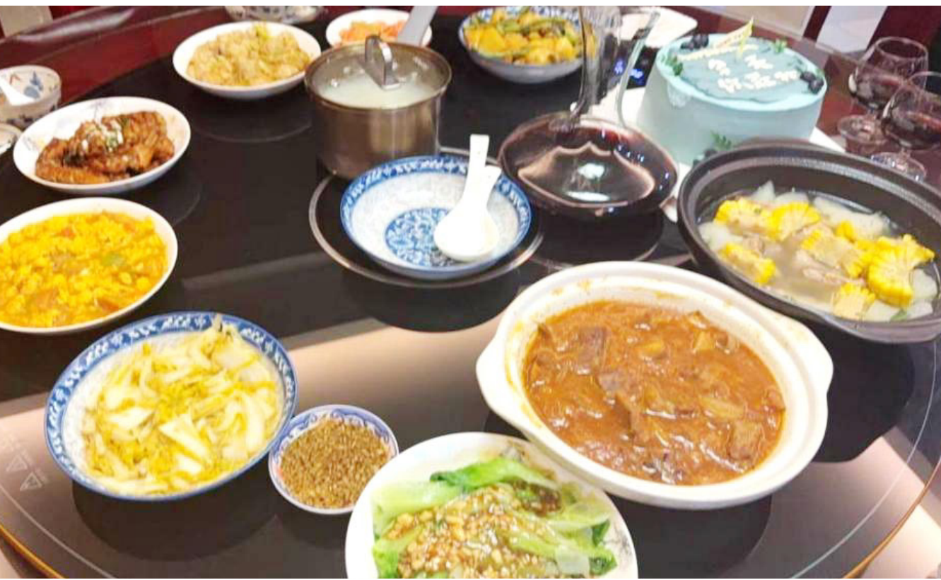
▶ 生日为自己做的一桌菜